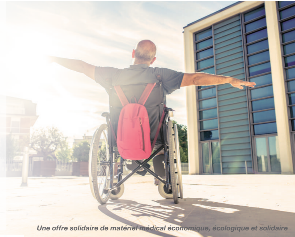
Une offre solidaire de matériel médical économique, écologique et solidaire

Un partenariat avec l'Adaptech de la Mutualité Française permet de proposer également les conseils d'un ergothérapeute.