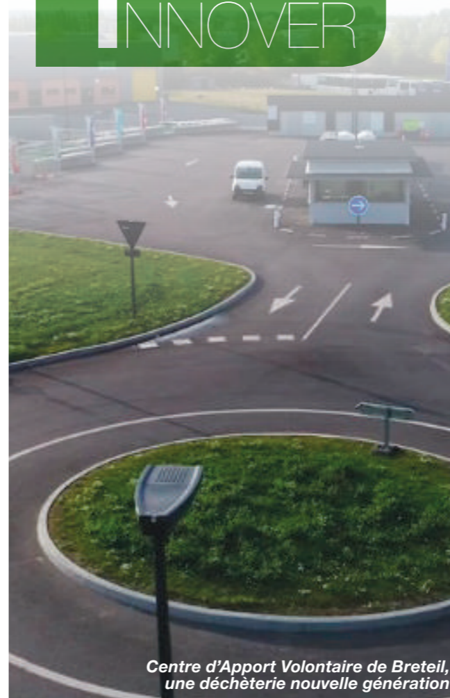
Centre d'Apport Volontaire de Breteil, une déchèterie nouvelle génération