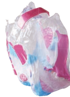
Tous les autres emballages en plastique