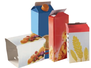
Les briques et emballages en carton