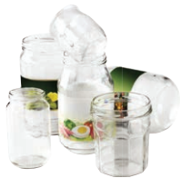
Les pots et bocal en verre