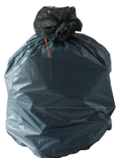
Les ordures ménagères