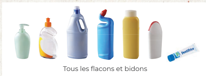
Tous les flacons et bidons