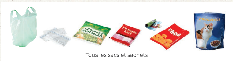
Tous les sacs et sachets