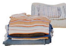
Les textiles (linge de maison, vêtements, chaussures)