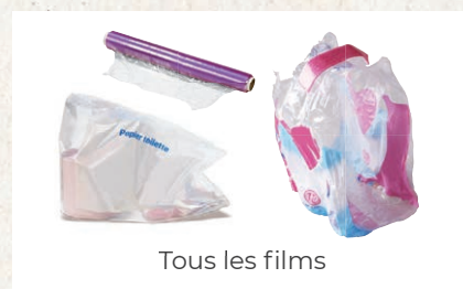
Tous les films