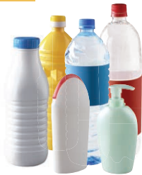
Les bouteilles et flacons en plastique