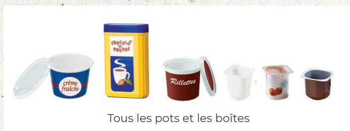
Tous les pots et les boîtes