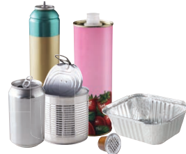
Les emballages en métal