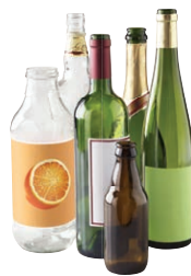
Les bouteilles en verre