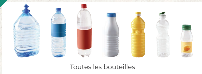
Toutes les bouteilles