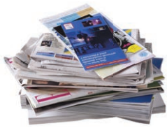
Les papiers (séparés de leur emballage plastique)