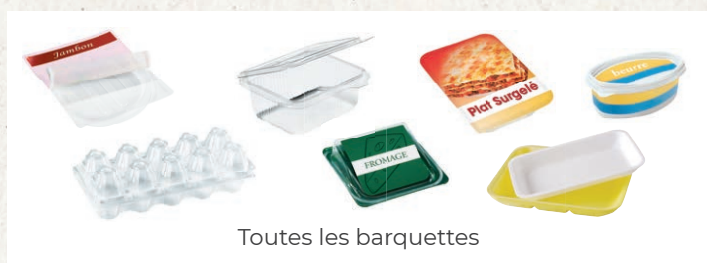
Toutes les barquettes